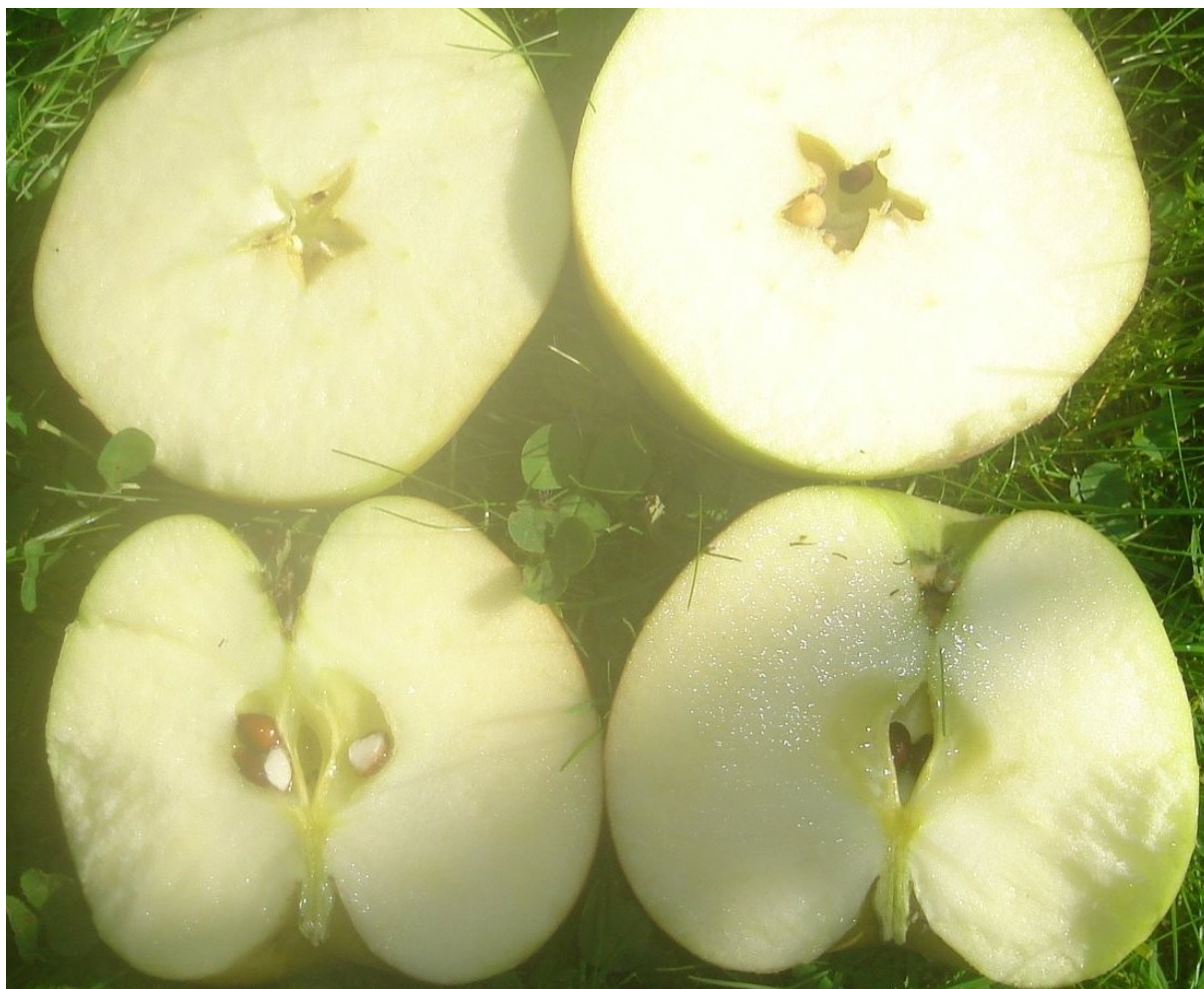
Deux photos aimablement proposées par Serge Vercauteren, Belgique.2010.

MATURITE-CONSOMMATION : Décembre-Février.